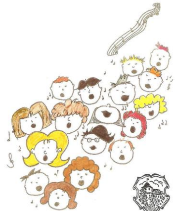
Gemischter Chor Remlingen

Redaktionsschluss für die Ausgabe Februar / März 2016 12. Januar 2016